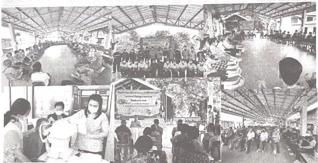
โรงพยาบาลส่งเสริมสุขภาพตำบลสว่าง ตำบลสำราญ อำเภอเมืองยโสธร จังหวัดยโสธร

งบประมาณกองทุนหลักประกันสุขภาพระดับพื้นที่หรือท้องถิ่น ตำบลสำราญ